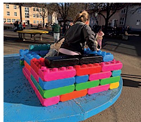
Die großen Bausteine im Einsatz

Wir haben an unserer Schule einen großen Schulhof, der besteht zurzeit nur aus einer großen Schotterfläche. In den Pausen war uns oft langweilig. Für fast 300 Kinder gab es nur zwei Wackelbalken und eine Wackelbrücke. Manchmal hatten wir Null-Bock in die Pause zu gehen. Gemeinsam mit Herrn Göthling pflanzten wir unseren „Spielepalast“. Zuerst musste ein Raum freigeräumt werden, Müll weggebracht, Tische weggeräumt und alte Springseile entknotet werden. Geholfen hat uns dabei der Hausmeister. Jetzt war der „Spielepalast“ recht ordentlich und es wurden die Spiele eingeräumt. Die Ausleihe machen wir selbst. Immer drei bis vier Kinder der vierten Klassen. Es ist immer eine sehr lange Schlange an der Ausleihe. Manche Sachen sind besonders schnell weg. Zum Beispiel unsere Walkie Talkies oder die großen Bausteine. Mit dem neuen Spielzeug machen die Pausen nun viel mehr Spaß. Dafür danken wir euch (Bürgerstiftung) sehr, weil mit eurer Hilfe und der Hilfe von